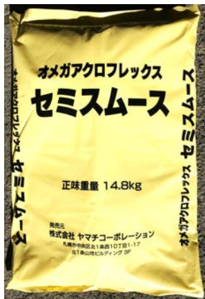
セミスムース用骨材