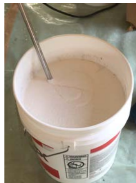
骨材が満遍なく混ざるように 攪拌する