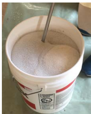
攪拌時に骨材やアクロチョイス が溢れないように注意