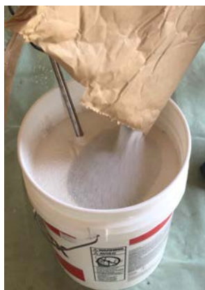
残りの骨材を溢れないように 入れる