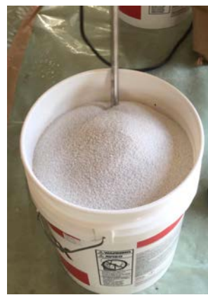
骨材が溢れないように 3/4くらいの骨材を入れる