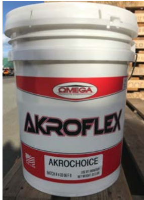
アクロチョイス レギュラーベース