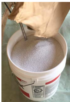
骨材は袋に残さず最後まで 入れる