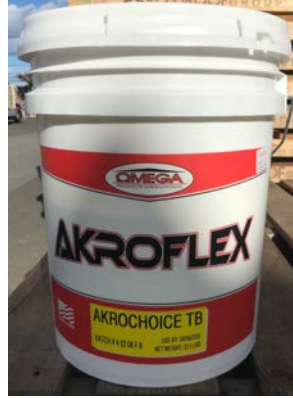
アクロチョイス ティントベース (TB)