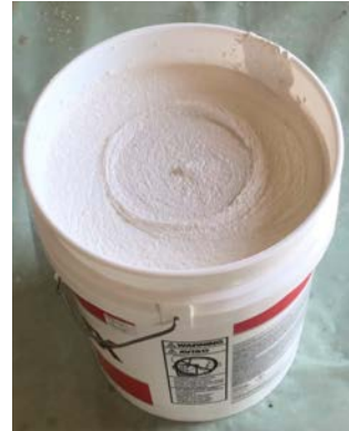
骨材が満遍なく混ざるように 攪拌する