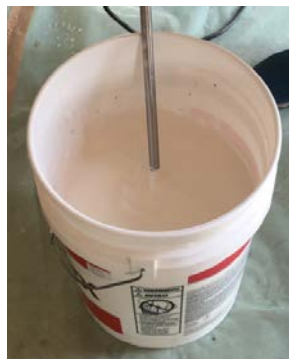
色が均一になるまで攪拌する

※アクロチョイスに先にカラーボトルを混ぜて攪拌してください。 骨材を入れてからカラーボトルを混ぜると混合しづらくなります。