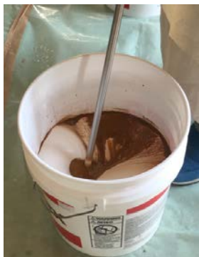
攪拌機でカラーを攪拌する