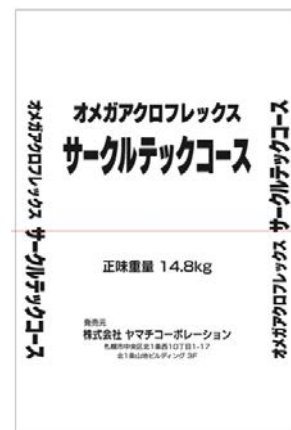
サークルテックコース用骨材