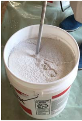
攪拌時に骨材やアクリロチョイス が溢れないように注意