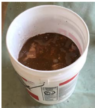
アクロチョイスのペール缶に カラーボトルを入れる

アクロチョイス1缶に対して、カラーボトルを1本入れて攪拌機で攪拌します。 色が均一になるまで攪拌してください。