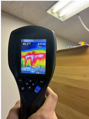
↑サウナヒーター設置側の 外壁の上部の温度

又、サウナルームの天井裏（外側）部分（ロックウール施工後／サウナヒーター設置部分）も約 50℃程度になります。