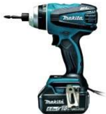
インパクト ※ビス関係は付属されています。