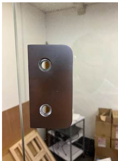
六角ネジを外した、ガラスドア