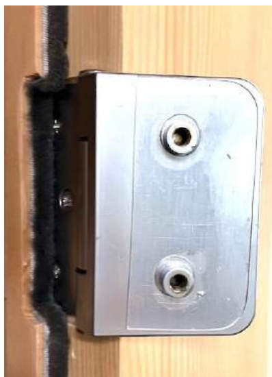
六角ネジを外した枠側のヒンジ