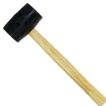
ゴムハンマー ※パネルのはめ込み時にありますと便利です。