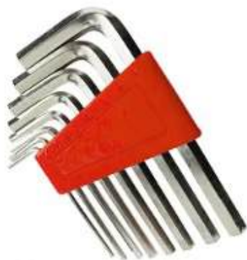
六角レンチ ※ガラスドアを外す場合に使用します。

※サウナヒーター施工時に必要な工具関係は、サウナヒーター取扱説明書に記載しています。